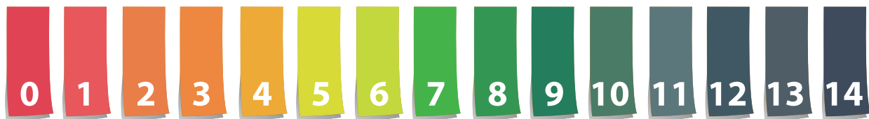
Scala dei valori di pH